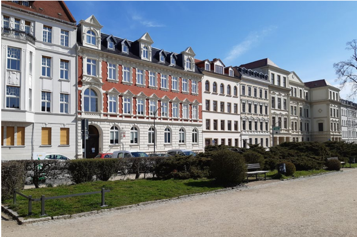
Abbildung 2: Wohnbebauung am Wilhelmsplatz in Görlitz.