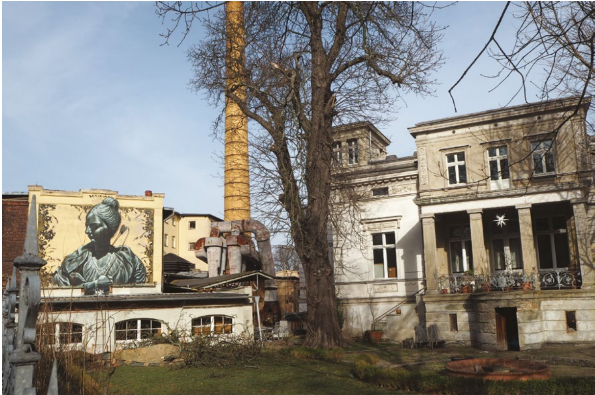
Webbanner zur Werbung für das Projekt in den Medien.