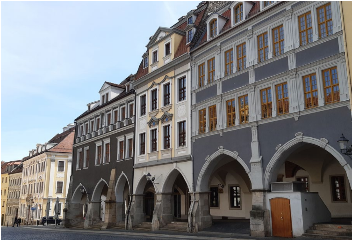
Abbildung 1: Untermarkt in der Görlitzer Altstadt.