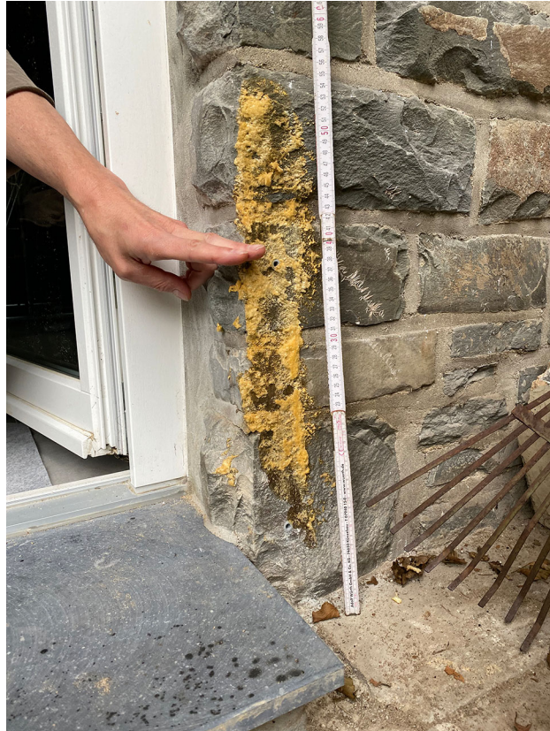
■ Abb. 6.9 Anwohner zeigt den Höchstwasserstand während des Hochwassers an.