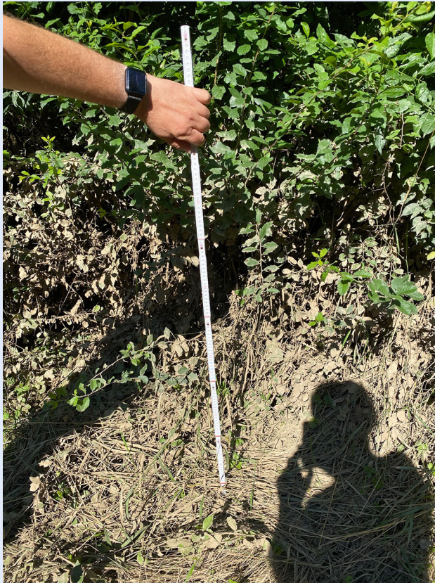
■ Abb. 6.1 Spuren der Hochwasserwelle an der Vegetation.

Um diese abzuschätzen, können Videoaufnahmen herangezogen werden, die während des Hochwassergeschehens angefertigt wurden. Hier ist man in der Regel auf Anwohner und Anwohnerinnen sowie Einsatzkräfte angewiesen, die das Hochwassergeschehen unmittelbar miterlebt und dokumentiert haben. Häufig finden sich weitere hilfreiche Videos und Bildmaterial auf Social-Media-Plattformen.