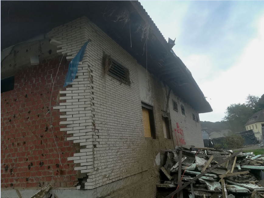
■ Abb. 6.2 Abgelöste Verklinkerung an einer Hauswand gibt Hinweise auf hohe hydraulische Einwirkungen während des Hochwassers.