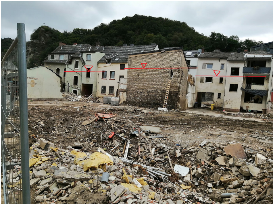
■ Abb. 6.4 An den Gebäuden sind Spuren des Hochwassers auf gleicher Höhe zu erkennen.

Die Beprobung von Flutsedimenten und das Einmessen von Flutmarken müssen folglich zeitnah nach dem Hochwasser erfolgen. Da insbesondere zentrale Infrastrukturen wie Brücken bereits wenige Tage nach dem Hochwasser zumindest provisorisch repariert werden, ist auch eine Fotodokumentation nur in einem kurzen Zeitfenster möglich.