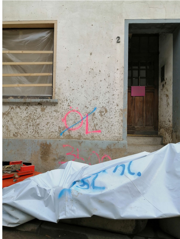
■ Abb. 6.3 Kennzeichnung von potentieller Ölkontamination an einem betroffenen Wohngebäude.