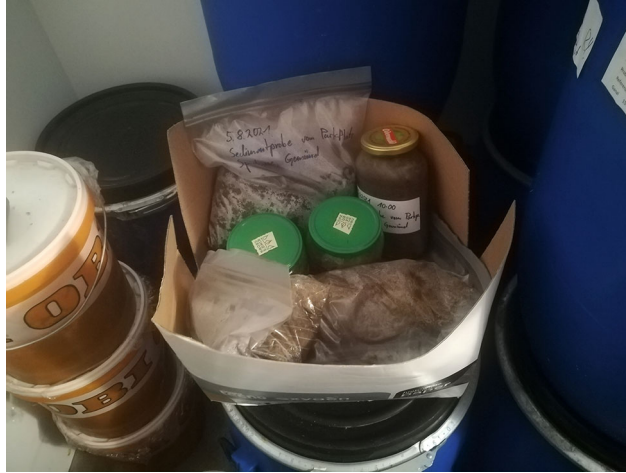
■ Abb. 6.7 Lagerung von Flutsedimentproben im Kühlraum des IWW. Die Proben befinden sich in provisorischen Behältnissen, wie handelsüblichen Gefrierbeuteln und Einmachgläsern.