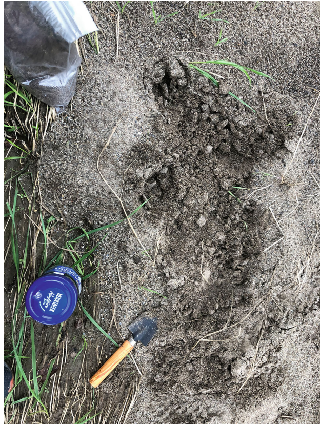
■ Abb. 6.6 Probenahme im Uferbereich an der Inde.

Für die Auswahl von Bereichen, in denen Sediment- und Wasserproben genommen werden sollen, sind insbesondere betroffene Schadstoffemittenten von Interesse. Flussabwärts von Industrien und historischen Industriestandorten sind ebenfalls erhöhte Schadstoffkonzentrationen zu erwarten. Zur genaueren Eingrenzung von Probenahmestandorten können Fließgeschwindigkeiten in Hochwassergefahrenkarten wichtige Informationen liefern. Typischerweise lagern sich vermehrt Sedimente in Bereichen mit reduzierter Fließgeschwindigkeit ab. In urbanen Bereichen, die aufgrund von Gebäuden eine sehr hohe hydraulische Rauheit haben, lagern sich ebenfalls große Mengen an Sedimenten ab. Zudem sind urbane Bereiche Schadstoffemittenten, beispielsweise für Schadstoffe aus dem Kanalsystem, Haushaltschemikalien, Heizöl oder Treibstoffe. Proben aus Gebäuden selbst oder der unmittelbaren Umgebung von Gebäuden liefern aufschlussreiche Daten. In betroffenen Kellern sammeln sich große Mengen Sediment, die oftmals ein umfassendes Bild über das lokale Schadstoffinventar ermöglichen. Außerdem lässt sich eine Belastung von Sedimentproben anhand eines Ölgeruchs oder der Kennzeichnung von Ölschäden an betroffenen Gebäuden ausmachen. Auf Auen mit Grünland lässt sich die Aufwuchshöhe (Nettohöhe der Ablagerung) der Sedimente gut an dem Bewuchs feststellen (■ Abb. 6.6).