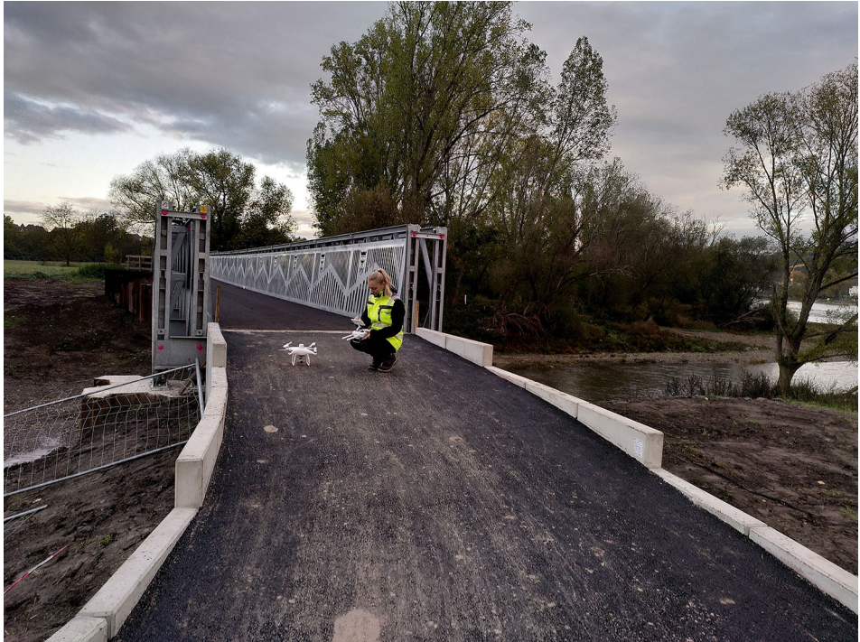
■ Abb. 6.8 Letzte Vorbereitungen vor dem Start der Drohnenaufnahmen.

präsent haben und sich entsprechend respektvoll verhalten. Die Bedürfnisse Betroffener haben immer Vorrang und auf die Erfassung von Daten ist in bestimmten Situationen zu verzichten.