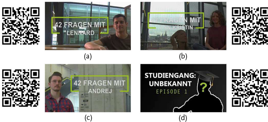
Abbildung 2: Thumbnails und QR-Codes des ersten (a), zweiten (b) und dritten (c) Videos der Reihe „42 Fragen an eine*n Ingenieurstudent*in“ und des ersten Videos (d) der Reihe „Studiengang: Unbekannt“

Im zweiten Video wird eine Masterstudentin (Umweltingenieurwissenschaften) interviewt. In dieser Einheit wird insbesondere der Aspekt beleuchtet, wie die Studentin als Frau im MINT-Bereich durch ihr Studium kommt und welche positiven und negativen Erfahrungen sie dabei bislang gemacht hat. Durch die fokussierte Perspektive werden die wichtigen und dringenden Themen der Gendersensibilisierung und Gleichstellung innerhalb ingenieurwissenschaftlicher und technischer Studiengänge beleuchtet und anhand persönlicher Erfahrungen greifbar gemacht. Hierdurch sollen sowohl aktuelle und zukünftige Studentinnen im MINT-Bereich bestärkt und unterstützt werden als auch insbesondere Studenten für die Themen Gender und Gleichstellung sensibilisiert werden.